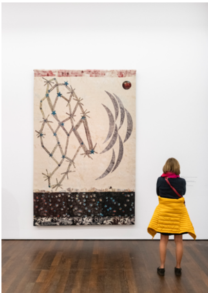
Ausstellungsansicht „Kiki Smith“