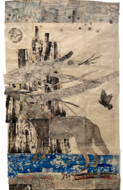
Kiki Smith, Cathedral layout , 2012

Bronze