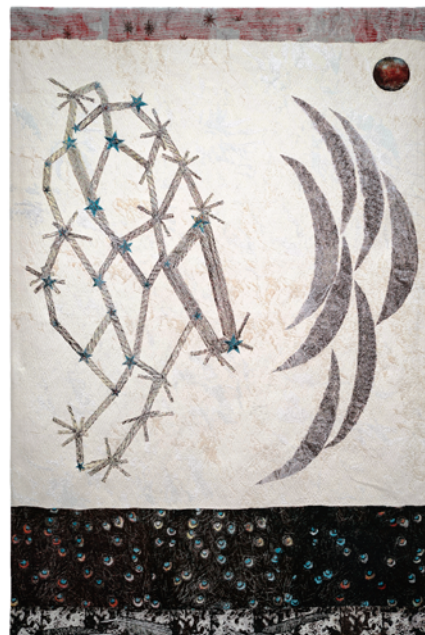
Kiki Smith, Visitor , 2015