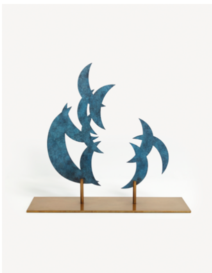
Kiki Smith, Shadow 3 , 2019