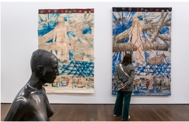
Ausstellungsansicht „Kiki Smith“