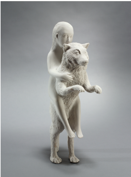
Kiki Smith Woman with Wolf , 2003

Farbstift, Blattgold und Tusche auf Nepalpapier