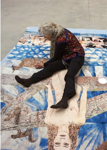
Kiki Smith im Atelier

Alle Arbeiten © Kiki Smith, courtesy Pace Gallery