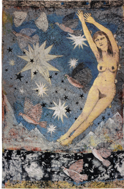
Kiki Smith, Sky , 2012