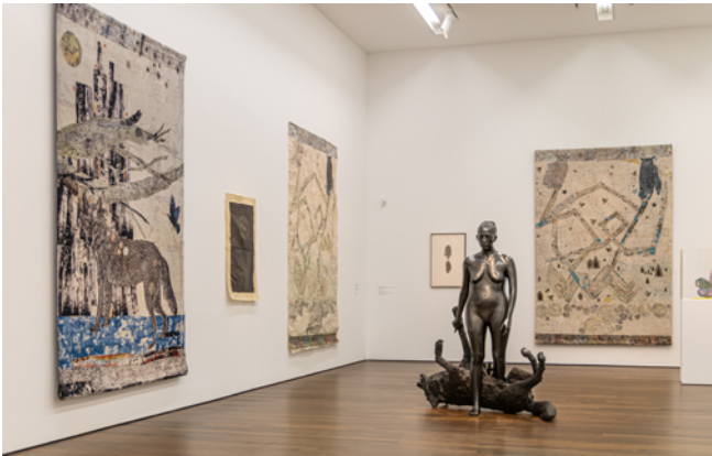
Ausstellungsansicht „Kiki Smith“