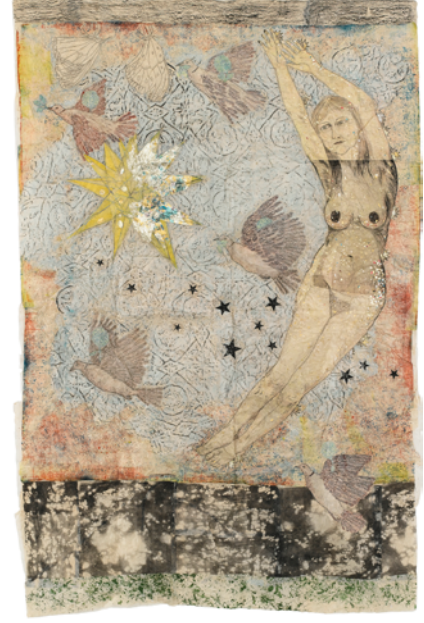
Kiki Smith, Sky , 2011

Jacquard-Tapisserie aus Baumwolle