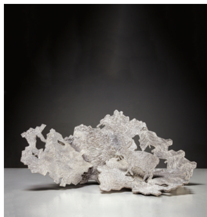
Kiki Smith, Hoarfrost , 2014