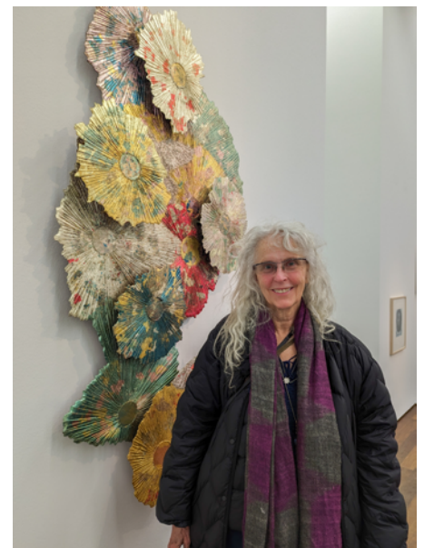
Kiki Smith vor ihrer Skulptur Harmonies III , 2011