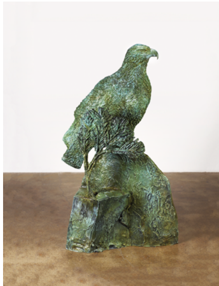
Kiki Smith, Eagle in the Pines , 2016

Porzellan