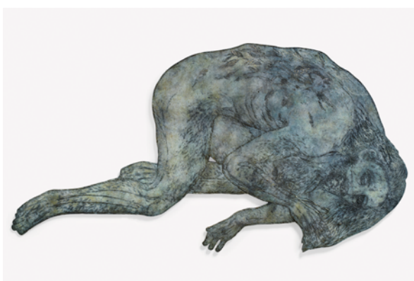
Kiki Smith, Fallen , 2018