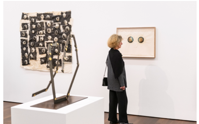
Ausstellungsansicht „Kiki Smith“