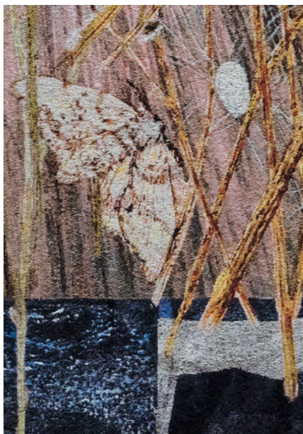
Kiki Smith, Spinners , 2014 (Detail)