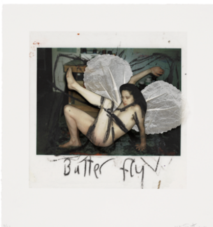
Kiki Smith, Butterfly, Bat, Turtle , 2000 [hier: Butterfly]