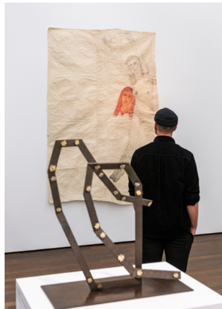
Ausstellungsansicht „Kiki Smith“